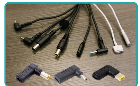
Cables adaptadores emuladores

La línea de carros Elevate cuenta con todos los elementos clave que las escuelas necesitan de un carro de carga. Tienen un peso considerablemente menor que el de otros carros, ocupan menos espacio y cuentan con ruedas giratorias, lo que los hace más fáciles de maniobrar en el aula. Lo mejor de todo es que, con la tecnología de carga USB-C Quick-Sense, eliminan la necesidad de usar cables de carga adaptadores de CA.