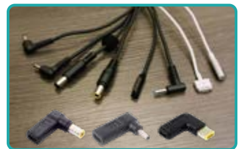
Câbles adaptateurs émulateurs

La gamme de chariots Elevate présente toutes les caractéristiques essentielles que les écoles recherchent dans un chariot de recharge. Ces chariots pèsent nettement moins que les autres, prennent moins de place et sont tous dotés de roulettes pivotantes, ce qui les rend plus faciles à déplacer dans la salle de classe. Mieux encore, grâce à la technologie de recharge Quick-Sense USB-C, ils éliminent la nécessité d'utiliser des câbles de recharge avec adaptateur secteur.